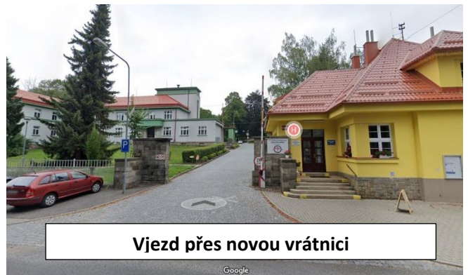
Vjezd přes novou vrátnici