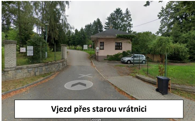
Vjezd přes starou vrátnici

Pozn.: psychiatrie má dva vjezdy blíž k centru města je stará vrátnice(tento vjezd je určen pro závodní automobily a ty, kteří jedou směrem nahoru k VIP stanu a jízdárně) / hlavní vjezd je umístěn u žluté vrátnice (tento vjezd je určen pro historická vozidla, motorky, policie, BESIP, stánky občerstvení, ... )